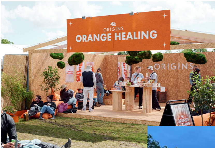
Origins, 8 facademeter

Ansøger du om en stand på Do Good Market, som er målrettet små, grønne iværksættere, forventer vi ikke certificeringer eller lignende, men anden dokumentation for jeres bæredygtige profil.