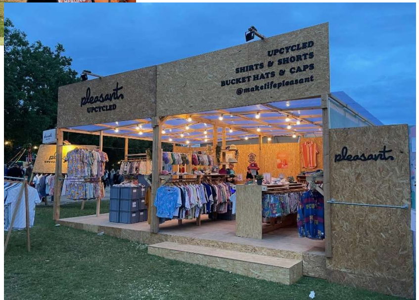
Pleasant, 8 facademeter

Er du interesseret i at søge om en nonfood-stadeplads på Roskilde Festival 2025 følger hermed nyttige informationer: